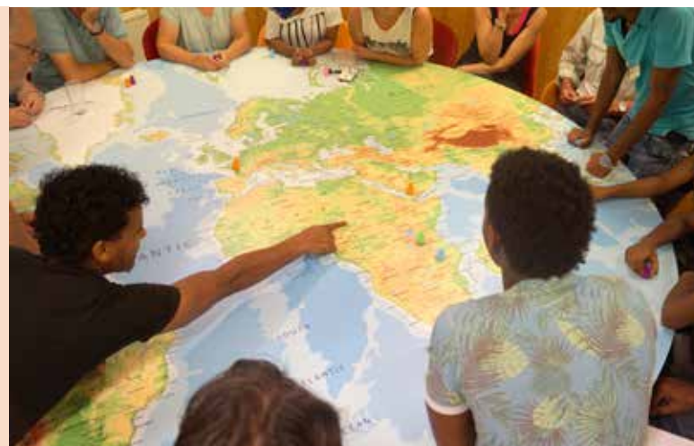
De Rondetafelkamer: daar kom ik vandaan

Op een centrale plek in Tilburg Noord, gelegen naast winkelcentrum Wagnerplein en sportcentrum De Drieburcht, vinden we Het Ronde Tafelhuis. Gevestigd in een modern ogend grijs gebouw, waarin ook de Stadswinkel en de Bibliotheek Midden-Brabant gehuisvest zijn. Op de gevel boven de ingang prijkt het woord VerHalenHuis . Zo grijs als de buitenkant is, zo kleurrijk is Het Ronde Tafelhuis (RTH) zelf.