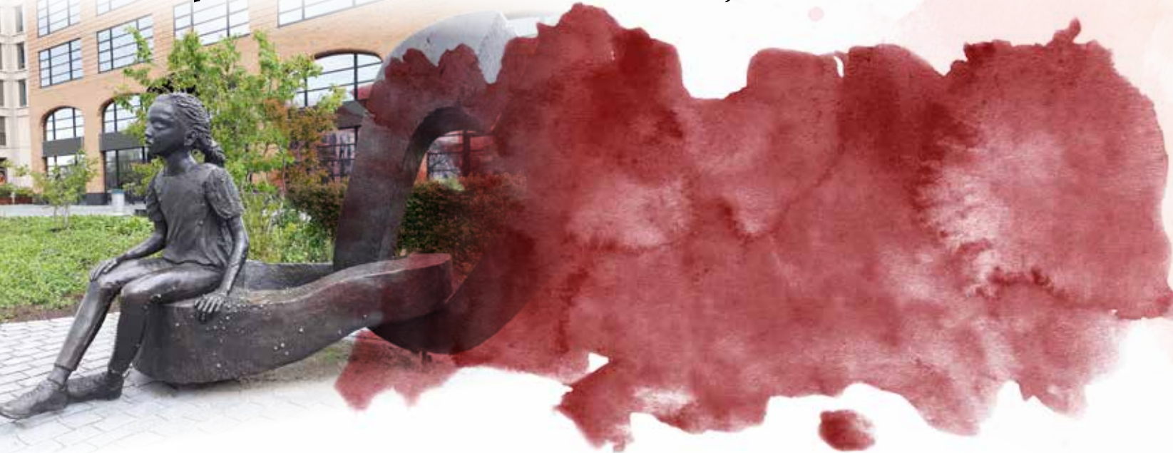
Monument ter herdenking van het slavernijverleden

- “Ik snap niet wat daar zo modern aan is” (Arjen Lubach) -