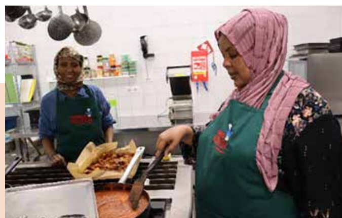
Bereiden van de lunch in de Wereldkeuken