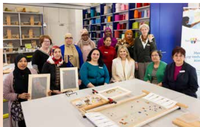
De Stik en Strijk-groep met koningin Máxima