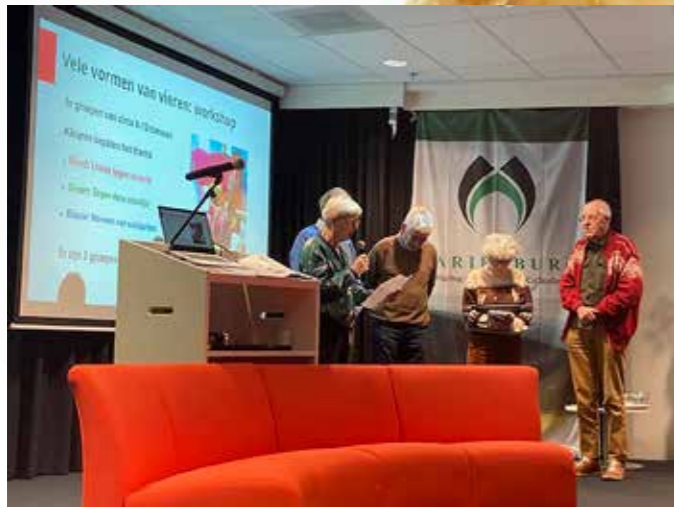
workshop Vele vormen van vieren