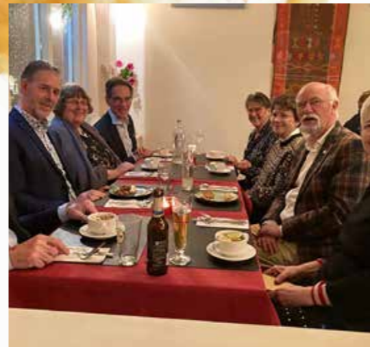
aan de lunch

Na een korte presentatie van de resultaten van de werkgroepen, zong de zaal uit volle borst De steppe zal bloeien , en sloot de dagvoorzitter de vergadering met een welgemeend dankwoord aan allen die van dit symposium een niet meer te vergeten evenement hadden gemaakt. En daarna gingen de deelnemers, na een feestelijk drankje, terug naar de wederom overvolle treinen. ●