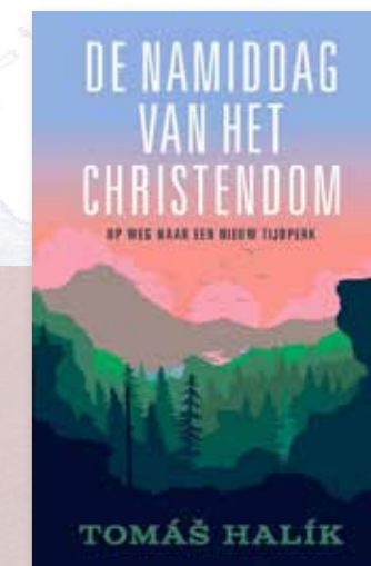
Tomáš Halík, De namiddag van het christendom , uitg. KokBoekencentrum, 2023, 252 pag.

Het enige dat de Kerk kan doen, zo geeft Halík duidelijk te kennen, is zich volledig omkeren van binnen naar buiten, luisterend naar en dienend voor iedereen. Dat betekent ook afstand nemen van dogmatisme, van wetsdenken, van krampachtig vasthouden aan regels en aan interne organisatie. Hoe dat dan allemaal in de praktijk tot stand zou moeten komen, daarvoor geeft hij geen concrete suggesties. De christenen zullen daarin samen een weg moeten vinden, want de boodschap van liefde kan alleen in gemeenschap duidelijk worden gemaakt: “Ziet hoe zij elkander liefhebben.” De wereld moet dat wel kunnen zien. Zal dat allemaal lukken? Gaan ‘de nadagen’ niet over in de avond die het einde betekent? Nee, Halík eindigt zijn boek hoopvol: “In het Bijbelse concept van tijd begint een nieuwe dag met de avond. Laten we niet het moment missen waarop de eerste ster aan de avondhemel verschijnt.” ●