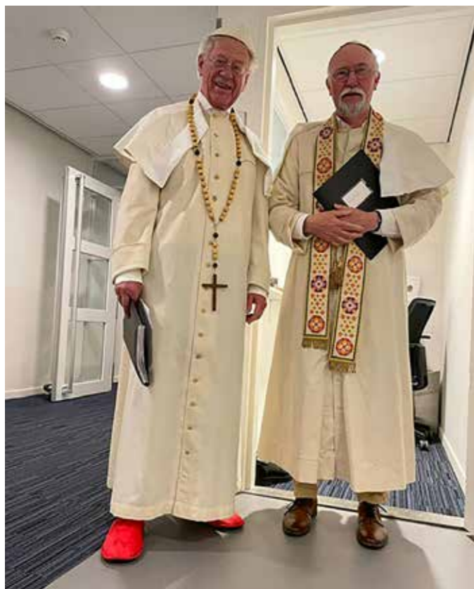
de twee pausen

Op zaterdag 18 november 2023 was er in Utrecht klaarblijkelijk veel te doen. De treinen die van alle richtingen op het Centraal Station aldaar aankwamen, waren overvol. Men zag jonge mensen op weg naar festivals en popconcerten, ouders met kinderen op weg naar de stad en ook bedaarde vijftigplussers op weg