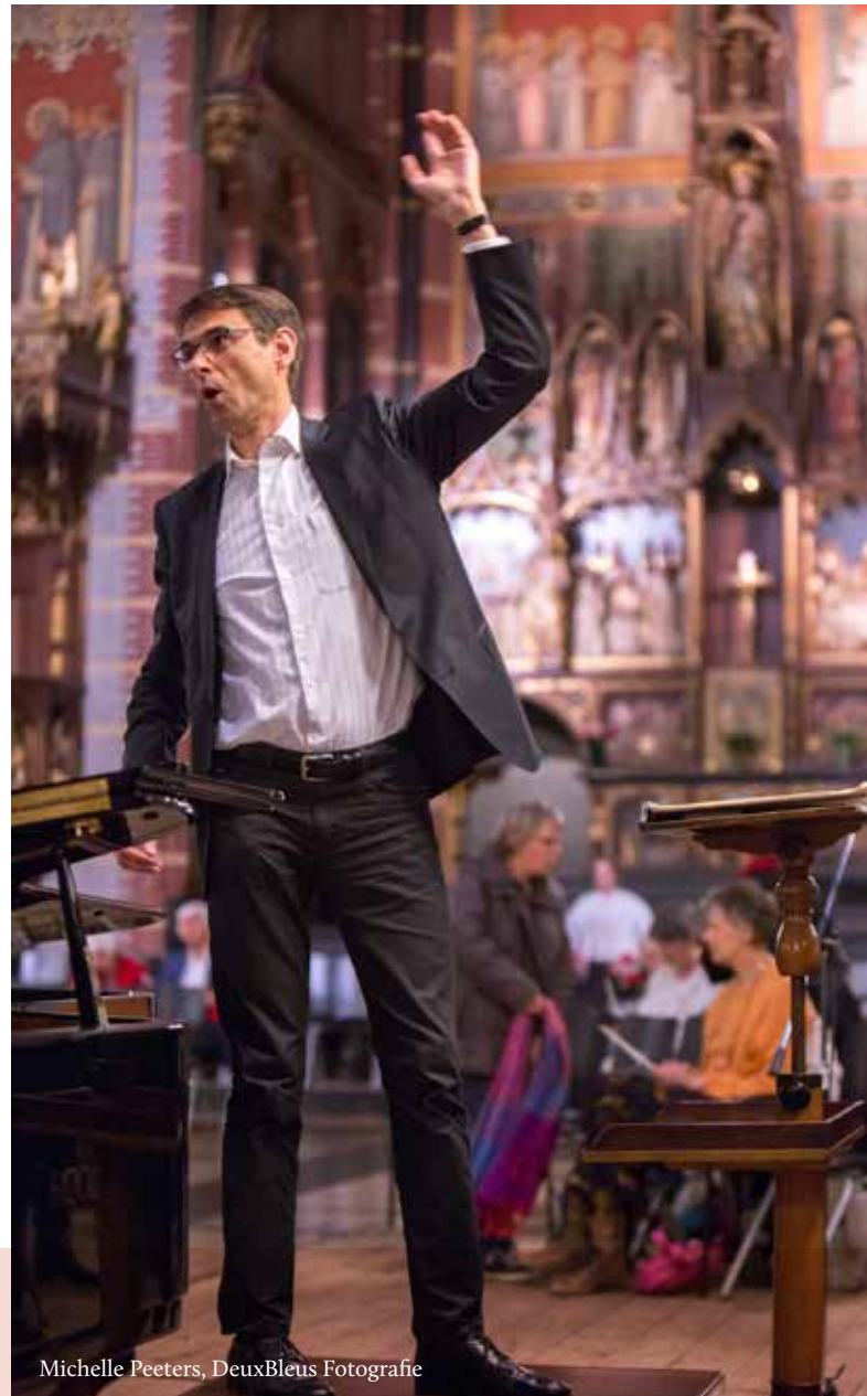
Michelle Peeters, DeuxBleus Fotografie

“Ik weet nog dat ik een kleine speelgoed-vleugel had gekregen en ontzettend moest huilen omdat ik die niet mee mocht nemen naar de kleuterschool. Of later. Ik kreeg met Sinterklaas een orgeltje; vriendjes belden aan met de vraag of ik buiten kwam spelen, maar ik zei 'nee' omdat ik orgel moest spelen. Toen ik met mijn ouders naar de gezinsdienst in Tilburg-Noord ging, wilde ik alleen maar helemaal vooraan zitten, naast het orgel. En toen ik twaalf jaar was, kwam ik zelf achter het orgel te zitten, eerst als invaller, later ook voor vast. Ik heb gezongen in het kinderkoor, orgel gespeeld. Later ging ik muziek