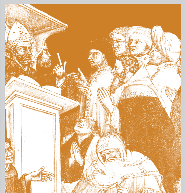
Augustinus (uiterst links) discussieert na zijn preek verder. (15e-eeuws fresco in Gubbio, Italië)

Dat veel mensen in onze tijd weer wat afstand wenssen te nemen van een te zwaar accent op het onderscheid tussen gewijd en niet-gewijd, is dus niet verwonderlijk. Er kunnen immers ongewenste ontwikkelingen plaatsvinden die om correctie vragen. Deze kritische mensen kunnen zich overigens beroepen op een onverdachte autoriteit, namelijk het kerkelijk wetboek dat, in goede aansluiting bij het Tweede Vaticaans Concilie, de volgende fraaie uitspraak doet: "Tussen alle christengelovigen, en wel krachtens hun wedergeboorte in Christus, bestaat een ware gelijkheid in waardigheid en handelen, waardoor allen, ieder overeenkomstig de eigen plaats en taak, aan de opbouw het Lichaam van Christus meewerken." (art.208). Binnen die ware gelijkheid vindt men verschillen in taken en verantwoordelijkheden, maar de gelijkheid staat voorop.