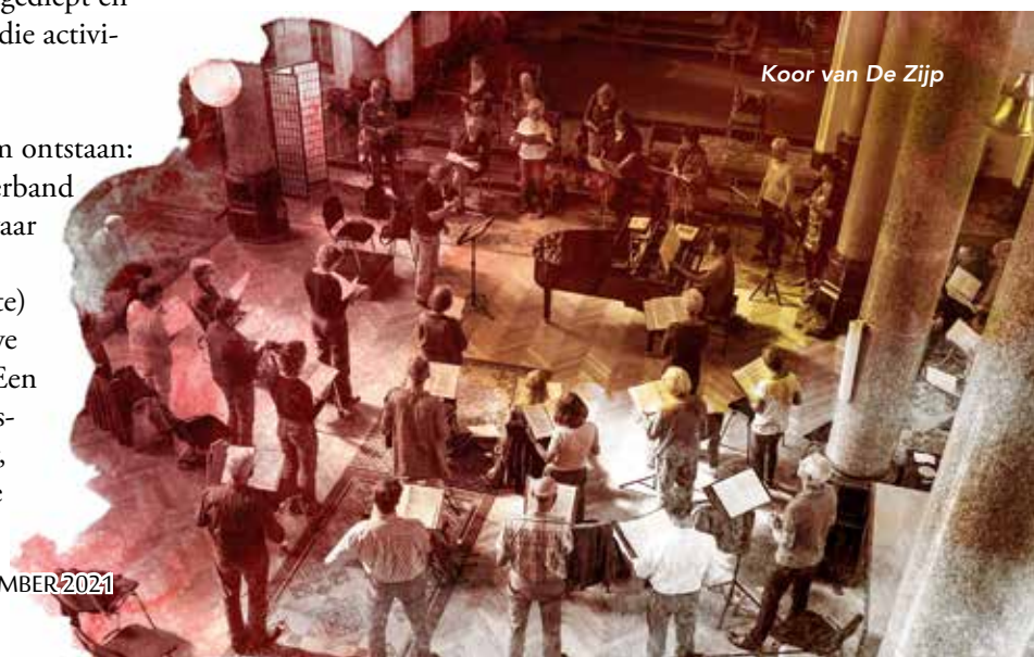
Koor van De Zijp