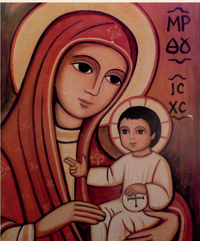
Klein Mariaportret in de kapel van Sulaymaniyah.

hiërarchie bij protestanten formeel niet bestaat, blijft onduidelijk wie er nu eigenlijk macht uitoefent. Dan ontstaan er netwerken en oncontroleerbare posities. En dat verlokt tot machtsmisbruik.