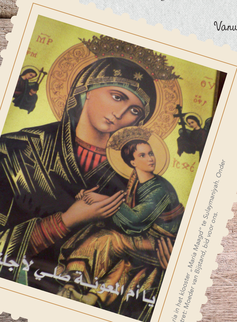
De Maria in het klooster „Maria Maagd“ te Sulaymaniyah. Onder het portret: Moeder van Bijstand, bid voor ons.