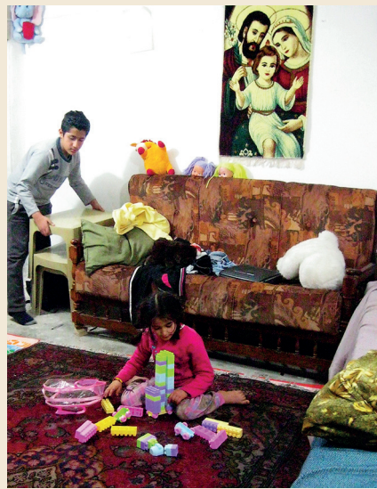
Een vluchtelingenfamilie die een klein huisje krijgt bij ons klooster als dank voor alle coördinatie. De Heilige Familie is hun wandversiering.