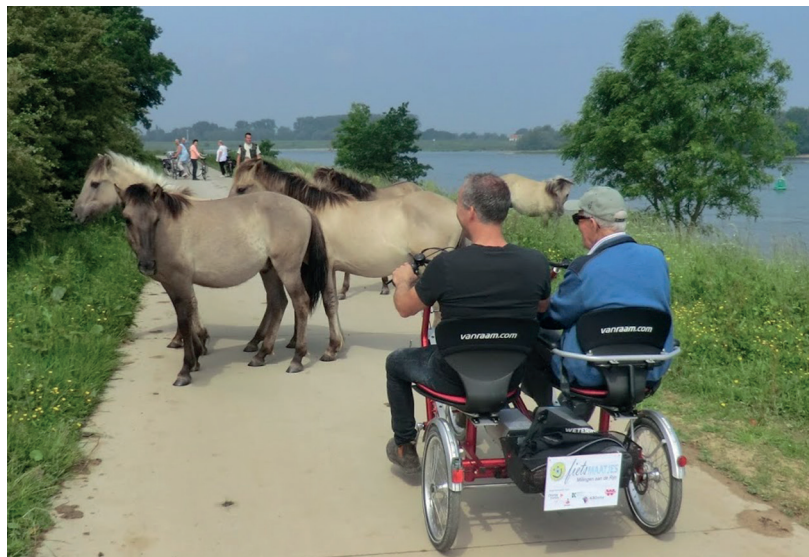
“Fietsmaatjes Millingen aan de Rijn”