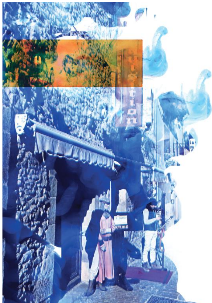
Het Inquisitie-Museum in het Zuid-Franse Carcassonne houdt de rooms-katholieke ketterjacht op Katharen en Albigenzen tot op de dag van vandaag in herinnering.

deelreligie van het christendom is de rooms-katholieke kerk. Die beslaat ca. 18 procent van de wereldbevolking (hindoeïsme 15 procent, islam 21 procent). Een van de recente pausen heeft het aangedurfd om te beweren, dat de niet-katholieke religies natuurlijk wel een deel van de waarheid verkondigen, maar dat alleen de rooms-katholieke kerk de volle waarheid kent en leert. Wat betreft het verwerven van de eeuwige zaligheid is zij de enige religie ter wereld die daartoe de (genade)middelen in huis heeft. Hoe die resterende niet-katholieke 82 procent van de wereldbevolking dat dan moet klaarspelen, is niet bekend.