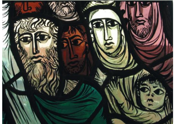
glas-in-loodraam van Charles Eyck in het voormalig Augustijnenklooster in Eindhoven

op die plek liet bouwen, is nog steeds de eerbiedwaardige plaats waar het allemaal begon. Een inmiddels zwart geworden steen – door de vele handen die hem beroerden – wijst nog preciezer de plek aan in de crypte. Eén van de mythen die het kind Jezus omringen is daar ontstaan. Elke belangrijke figuur, in welke traditie ook, moet tastbaar gemaakt worden vanaf het moment van geboorte. Maar hoe wist die familie na ruim driehonderd jaar nog waar de geboorte-grot was van een armoedig stel dat daar tijdelijk gewoond zou hebben? Dat daar herders bij geweest zijn lijkt logisch, maar de komst van een rijke karavaan met koningen, die wij ook verbloemd 'wijzen' hebben genoemd, is niet aannemelijk. Een vervelende opmerking komt van de archeologen, die daar geen enkele aanwijzing hebben gevonden dat het dorpje in de eerste eeuw bestond. Dit verhaal kan afgeleid zijn van Mattheus 2, vers 6: 'Betlehem, land van Juda, u bent zeker niet de minste onder de leiders van Juda, want uit u zal een leider voortkomen, die herder zal zijn van mijn volk Israël.' Die leider, Jezus, werd toen al 'zoon van God' genoemd, maar dat was een joodse uitdrukking die niet de zwaarte van de uitleg van het concilie van Nicea had, God van God, eniggeboren zoon van de Vader. In die tijd was ook de maagdelijkheid van Maria nog niet uitgesproken en Anna wist