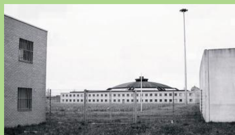
De koepelgevangenis Lelystad.