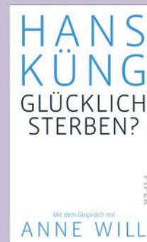
Hans Küng: 'Glücklich Sterben?' (München/Zürich: Piper, 2014), 159 blz., € 16,99

Daarom voert de dood niet in het niets, zoals ook de oerknal niet uit het niets komt. Wanneer een mens aan het einde van haar/zijn leven komt, wacht haar/hem niet het niets, maar dat alles dat gelovige joden, christenen en moslims God noemen, bij wie de doden goed geborgen zijn. Juist om een dood in waardigheid zeker te stellen, mogen christenen vanuit hun geloof indien nodig het tijdstip zelf kiezen.