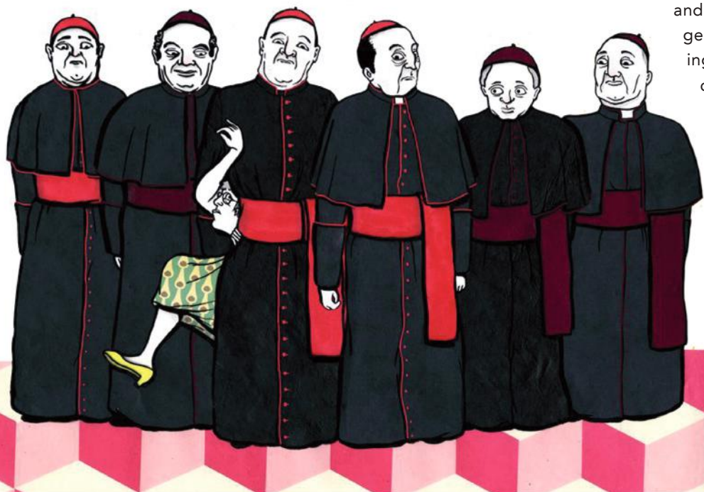
De tekenaar van 'Le Monde' zag het zo...

"Afgezien van enkele uitzonderingen – die mijn voorkeur hebben – spreken allen een vrijwel onbegrijpelijke taal voor hen die niet tot de kleine groep van de geestelijkheid behoren: 'affectiviteit' in plaats van 'seksualiteit',