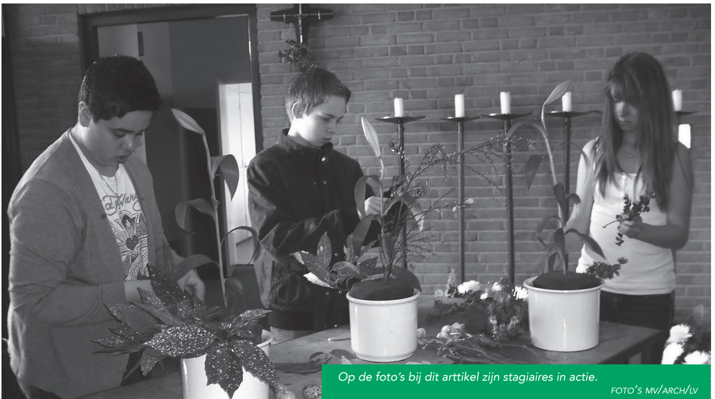
Op de foto's bij dit artikel zijn stagiaires in actie.

Zie voor een stappenplan de brochure 'MaS in de parochie' op de website www.bisdomdenbosch.nl/Diaconie/Documents/MaS%20Brochure%20definitief.pdf