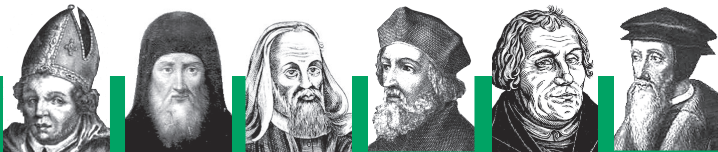
De beroemdste tot ketter verklaarde mannen uit de kerkgeschiedenis, v.l.n.r. Arius, Nestorius, Pelagius, Hus, Luther, Calvin.