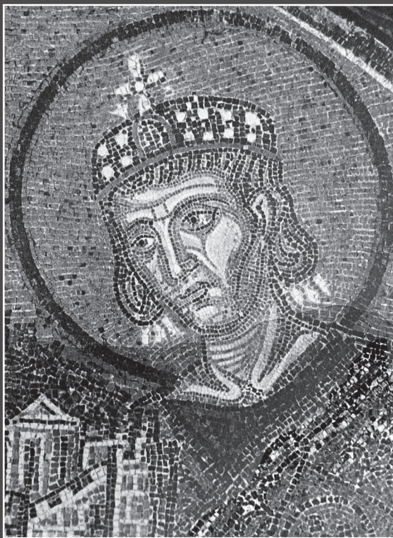
Links: Gouden munt als medaillon van Theodosius, de laatste Romeinse keizer (Washington, Freer Gallery).

Zo vormden de jaren tachtig van de vierde eeuw een keerpunt in de geschiedenis van het vroege christendom en tegelijk in die van de westerse beschaving. In het jaar 380 vaardigde Theodosius, als keizer van het Oost-Romeinse rijk met als