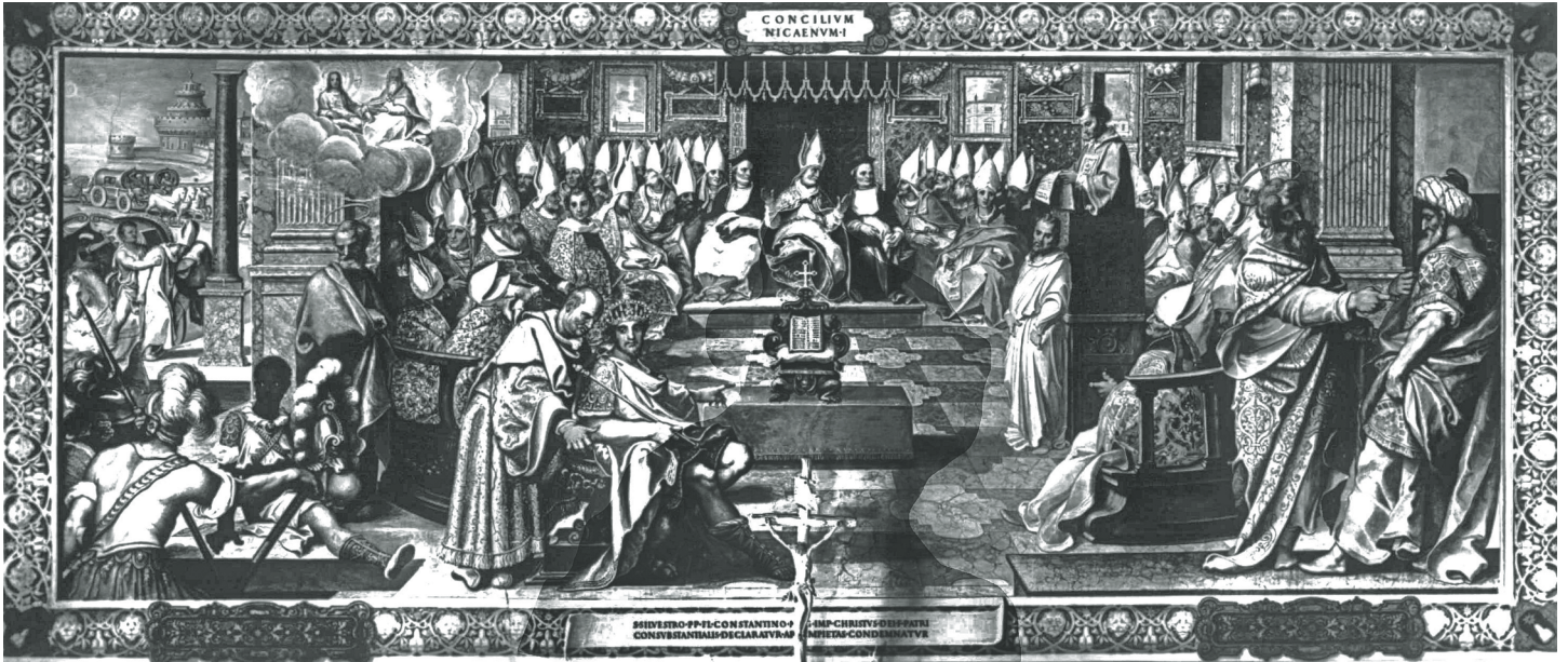
Het Concilie van Nicea. Muurschildering uit 1587, in opdracht van paus Sixtus V aangebracht op een wand van de bovenverdieping van de pauselijke bibliotheek, de zogenoemde 'Salone Sistina' in het Vaticaan. Uiterst links op de achtergrond wordt de ketter Arius gearresteerd, omdat hij volhield dat Gods zoon Jezus minder God was dan de God

de Vader. Voor alle duidelijkheid is daarnaast een wolk geschilderd, waarop Vader en Zoon evenwaardig naast elkaar zitten. Op de voorgrond, iets links van het midden zit keizer Constantijn.