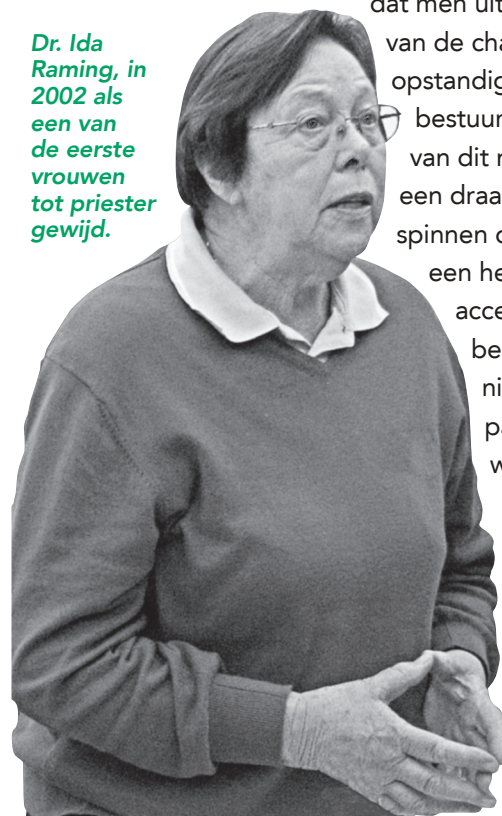
Dr. Ida Raming, in 2002 als een van de eerste vrouwen tot priester gewijd.

dat men uit het kluwen van de chaotische opstandigheid en bestuurlijk gezeur van dit moment een draadje kan spinnen om daarmee een hedendaags, acceptabel, bestuurlijk nieuw patroon te weven.