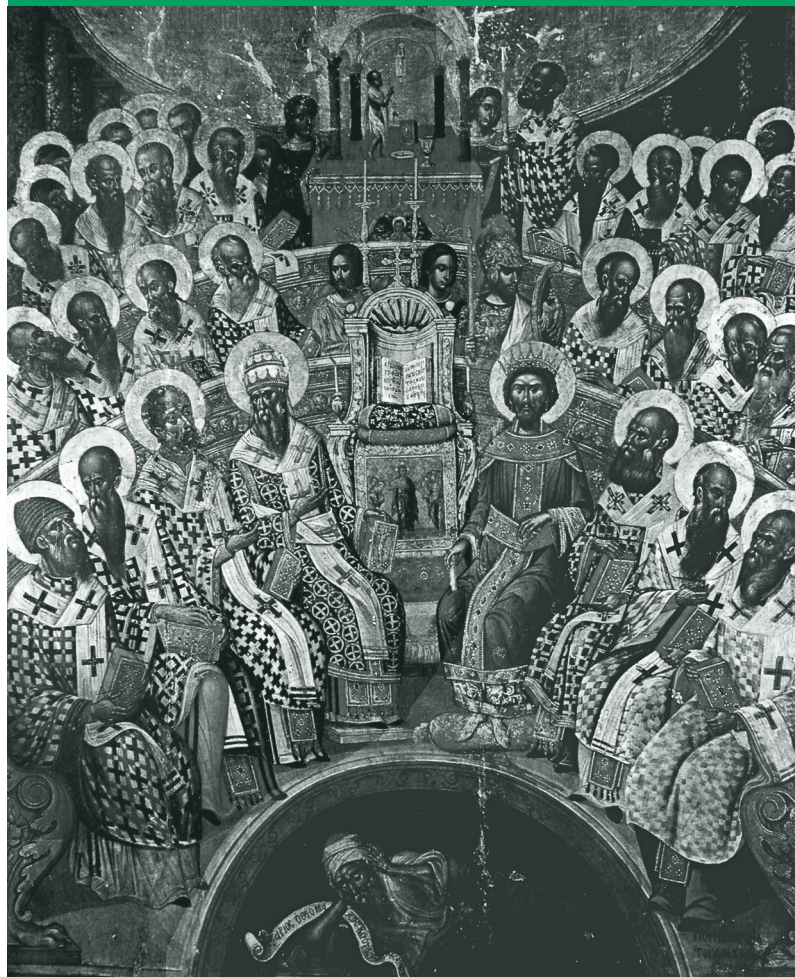
Schilderij (16e eeuw) van het Concilie van Nicea. Een gedeelte van de ca. 250 bisschoppelijke deelnemers zit geschaard rond een opengeslagen bijbel; rechts daarvan keizer Constantijn. In de kelder beneden zit de als ketter veroordeelde priester Arius opgesloten.

Al snel na zijn aantreden als keizer van het Oosten in het jaar 379, richtte Theodosius zijn aandacht op de onenigheid over de verhouding tussen God de