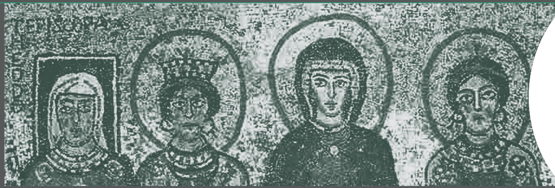
Een mozaïek in de St. Praxediskerk in Rome toont, tweede van rechts, de maagd Maria. Aan weerszijden vrouwen in het ambt in de vroegchristelijke Kerk, aan haar linkerkant St. Pudenciana en aan de rechterkant St. Praxedis, beiden leidsters van een huiskerk. Uiterst links, met rechthoekige nimbus, Theodora, rond het jaar 820 verbonden aan de St. Praxediskerk. Haar functie staat erbij vermeld: 'Episcopa Theodora', bisschop Theodora.

kerkelijke rechtbank. Ondanks dat het Vaticaan zijn favoriete bisschoppen zoals deze Burke beloont met topbanen, gaat de beweging van RCWP strijdbaar voort.