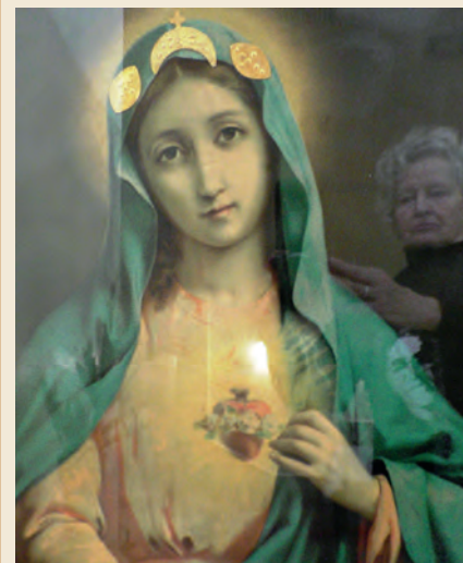
Een Maria in de kapel van Sulaymaniyah.

MARIENBURG MAGAZINE VAN EN VOOR KRITISCH KATHOLIEKEN