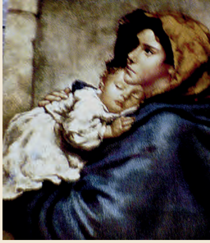
Wandkleed van Maria, gemaakt door een van de vrouwen van 150 IDP's die drie jaar lang in dit klooster te Sulaymaniyah werden opgevangen. Als dank.

belangen moet God voor hen dienen en welke karren moet hun god trekken? Het is altijd de vraag: wie is er aan het woord en wat betekent dat? Het maakt wel degelijk uit wie iets zegt. Toen Martin Luther King zijn volk opriep de strijd gewelddoos te voeren, was dat profetisch. De Ku Klux Klan, president Verwoerd van Zuid-Afrika, het waren racisten; wat als zij de gewelddoosheid van Martin Luther King hadden geciteerd om de zwarte gemeenschap haar plek te wijzen? Hoe vals had dat geklonken? Een profetisch woord zou zo tot een brutale leugen zijn geworden. Waarheid bestaat nooit in abstracte zin. God werd mens in deze wereld, waarin zeer scheve verhoudingen de dienst uitmaken. De vraag: wie spreekt, binnen welke situatie en tot wie, geeft uiteindelijk de betekenis aan de woorden. Spreken over Maria in, vanuit en door geloofsgemeenschappen die nog steeds mannenbolwerken zijn, is dan ook geen onschuldig spreken. De context geeft veel betekenis mee. Kun je hier wat mee?